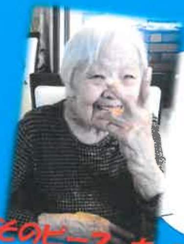
そのピース、カッコいいですね!