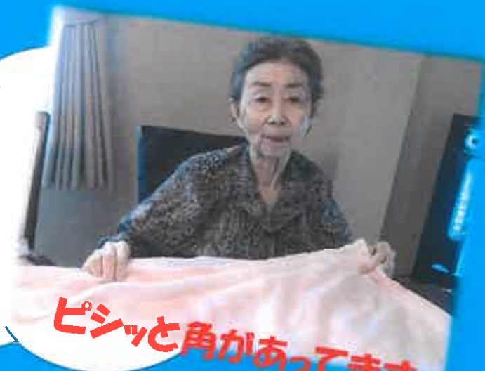
ピシッと角があります。