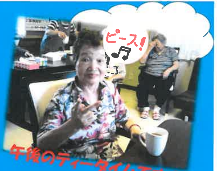
午後のティータイムです！