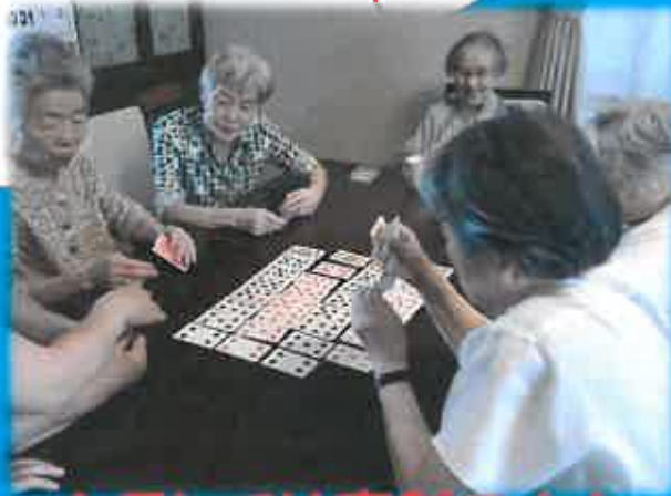
トランプは真剣です！