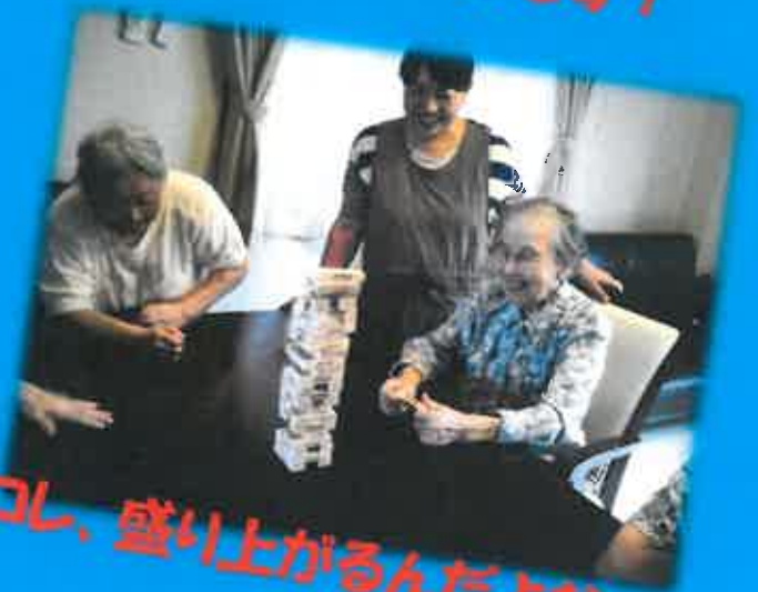
よし、盛り上がるんだよね