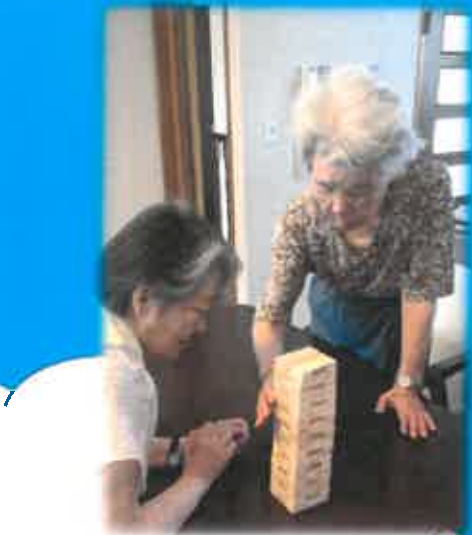
協力して楽しめます！