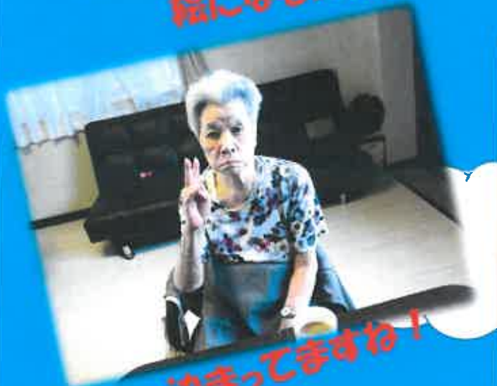
決まっていますね!

本当に笑顔がいっぱいの 当事業所。いつでも見学 可能です。お気軽にお立 ち寄りください。