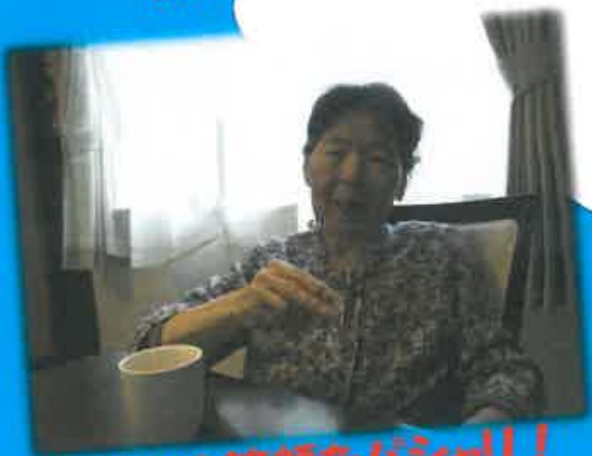
いつもの笑顔をバシッ！