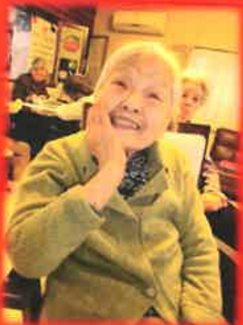
オシャレ大好きなんです！