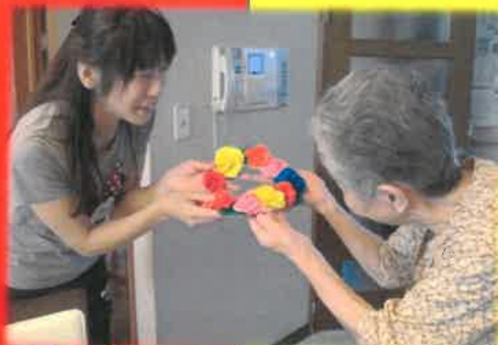
ご利用者様と一緒に、スタッフへのサプライズ誕生日プレゼント！大成功でした！