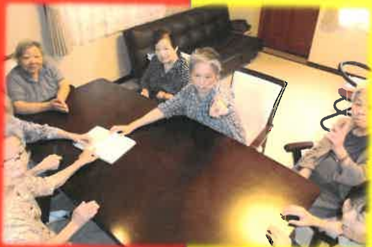
何を話し合ってるのかなあ！？