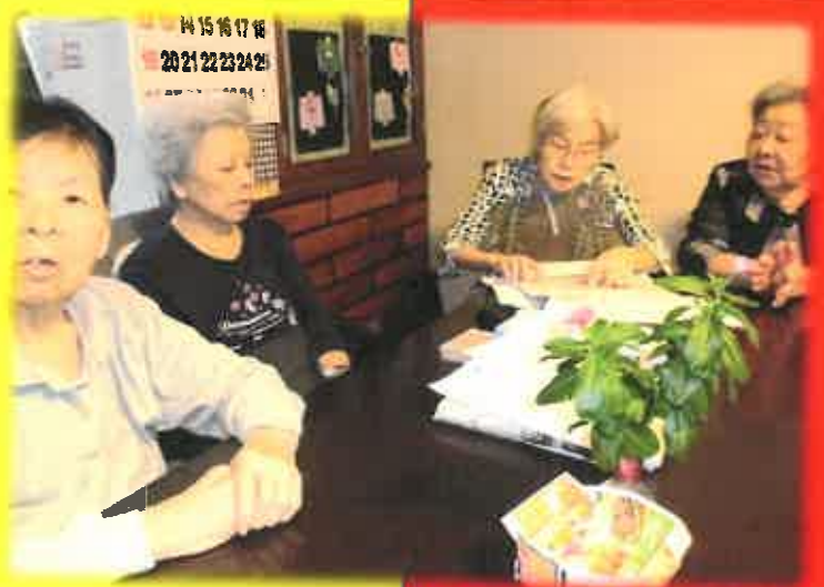
歌詞集を見ながら、「何を歌おうかなあ！」