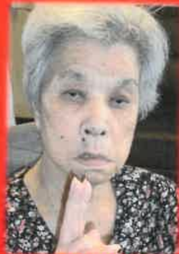
ピース、ありがとう！