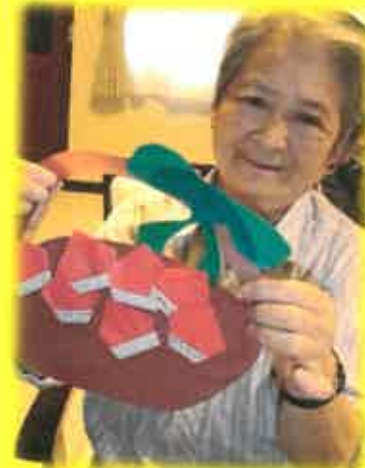
綺麗に出来ましたね！