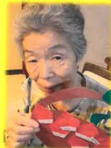
この日は栗ごはんだったね。