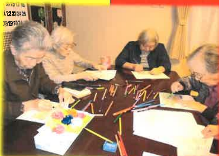
ぬり絵は、皆様の個性が発揮されます！