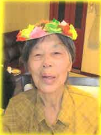
お誕生日のリース！