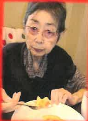
流行のパンケーキ！