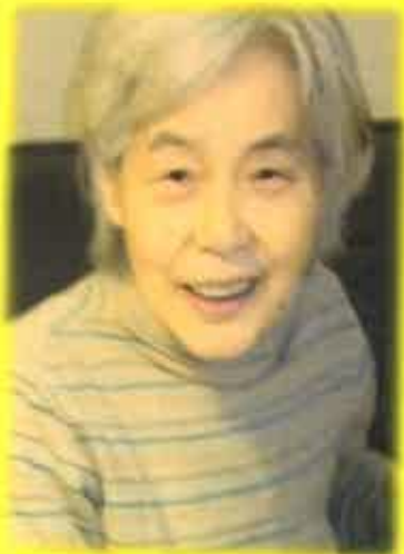
とっても良い笑顔！